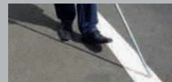
✓ Ligne guide contrastée.