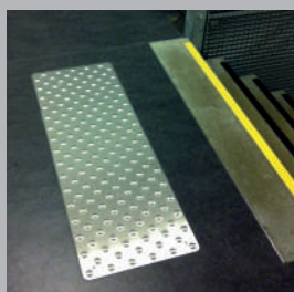
✓ Plaque inox à sceller