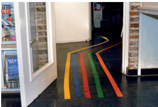
✓ Lignes guides colorées