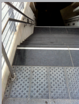
✓ Éveil à la vigilance.