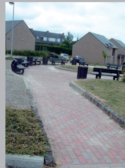
✓ Ligne guide naturelle vers l'entrée.