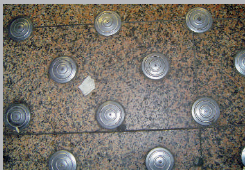
✓ Plots à coller ou sceller