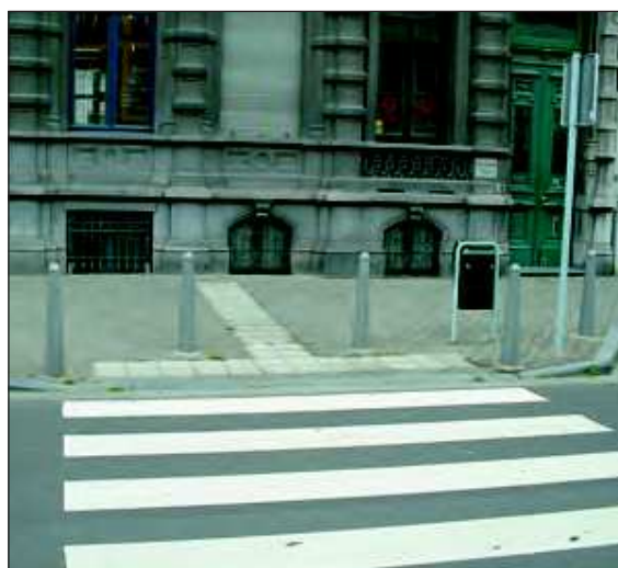
Figures 1 à 3: implantation type des dalles dans des traversées simples.