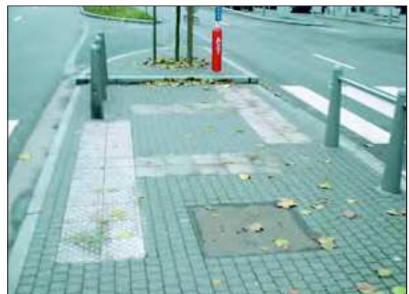
Figures 1 à 3: implantation type des dalles dans des traversées en baïonnette.