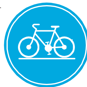
Figure 1 : panneau D7.