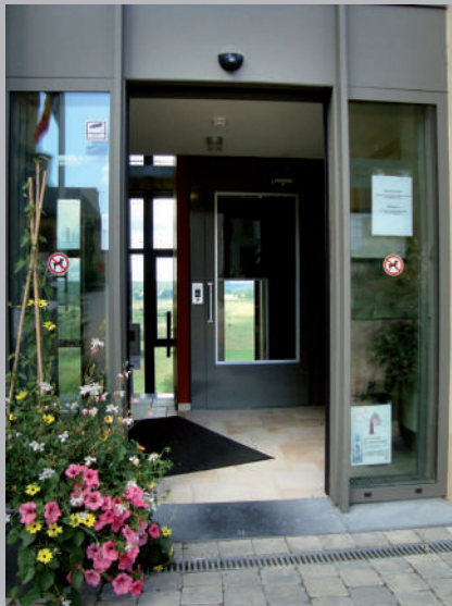
✓ Entrée de plain-pied