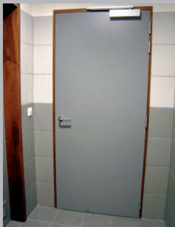
❌ Distance latérale insuffisante du côté de la poignée de porte