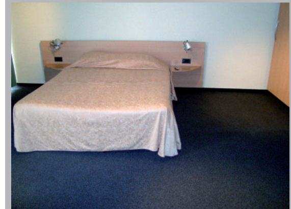
✓ Aire de rotation disponible d'un des côtés du lit