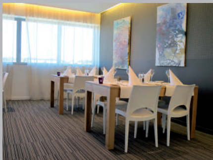
✔ Libre passage entre tables suffisant et aires de rotation disponibles