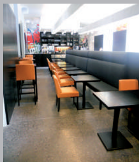
✘ Largeur de passage insuffisante entre les tables et tables trop petites