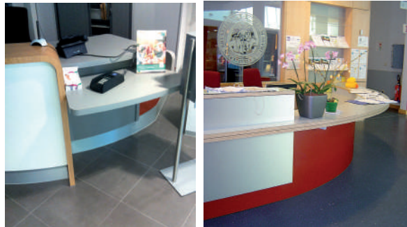
✓ Accueils rabaissés

• Une attention particulière sera portée à l'éclairage et à l'acoustique (cf. fiches « éclairage » et « acoustique »).