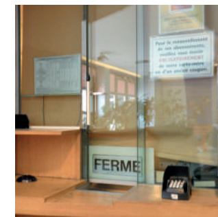
✗ Lecture labiale difficile à cause des reflets et contre-jours