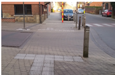
✓ Potelet placé en bordure du dispositif podotactile

Des potelets sont juxtaposés aux dalles à protubérances, du côté de la rue principale, afin de protéger le dispositif podotactile du passage des véhicules entrant dans la rue secondaire.