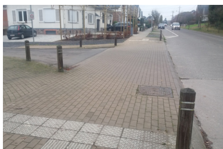
✓ Trottoir traversant de plain-pied avec les trottoirs qu'il relie et revêtement identique