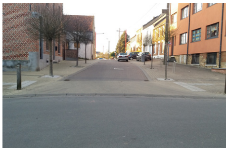
✓ Bordure du côté de l'axe principal plus longue que celle de la rue secondaire