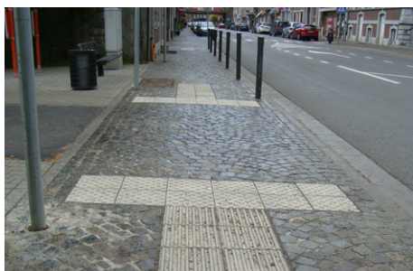
✓ Trottoir traversant pourvu d'un dispositif podotactile