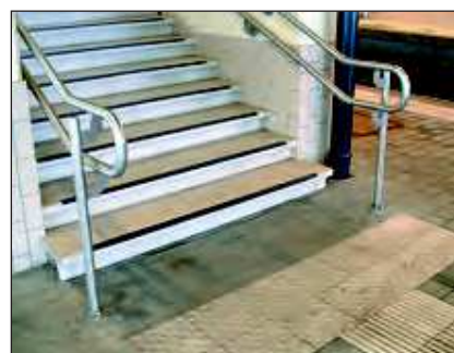
Figures 1 à 4: des escaliers sûrs pour les PMR.